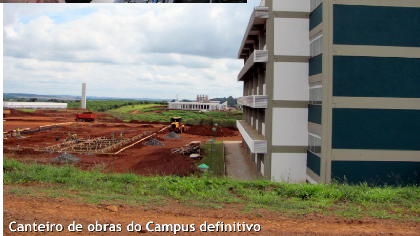
Canteiro de obras do Campus definitivo