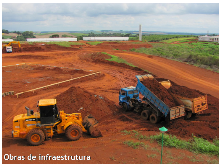
Obras de infraestrutura