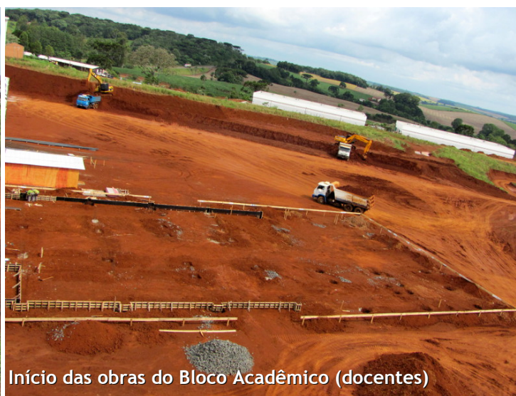
Início das obras do Bloco Acadêmico (docentes)