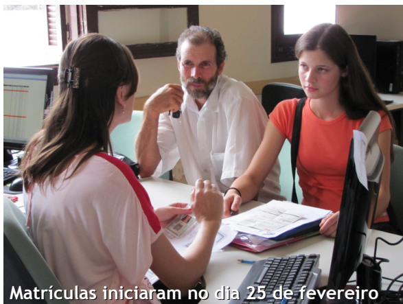
Matrículas iniciaram no dia 25 de fevereiro

À princípio, as aulas dos cursos de pós-graduação serão realizadas na escola JB nas sextas-feiras à noite e no Seminário durante os sábados.