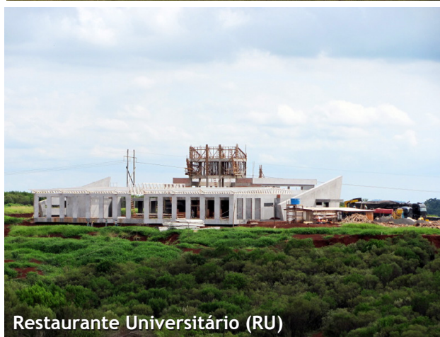
Restaurante Universitário (RU)