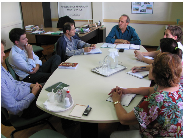
Reunião, no Campus Erechim, aconteceu na segunda-feira (11) da UFFS, das 13h30 às 17h30 horas.

Ao deflagrar a organização do evento, uma equipe de Conselheiros do Campus de Erechim esteve reunida no dia 11 de março. Na oportunidade foram iniciados os debates sobre a temática e a metodologia de organização da Audiência Pública. A data sugerida para a atividade é 15 de junho de 2013 (sábado), no auditório da UFFS Campus Erechim, das 10 às 17 horas. O grupo também definiu a data da pré-audiência de Erechim, que deverá ocorrer no dia 24 de maio de 2013 (sexta-feira), também no auditório