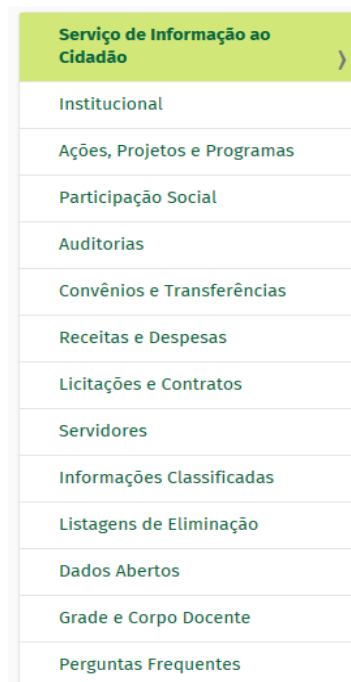
Figura 01: Acesso à Informação

Nessa seção estão disponibilizadas diversas informações de interesse dos cidadãos. Acesse aqui