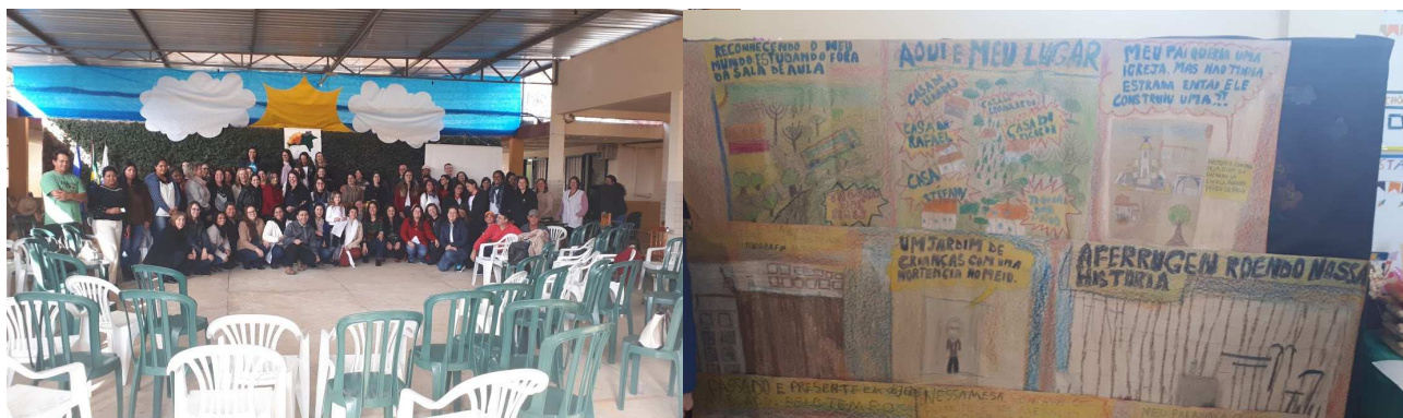
Campo Largo – 2019