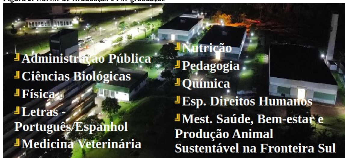
Figura 3. Cursos de Graduação e Pós-graduação

Fonte: Assessoria de Planejamento – ASSPLAN – RE