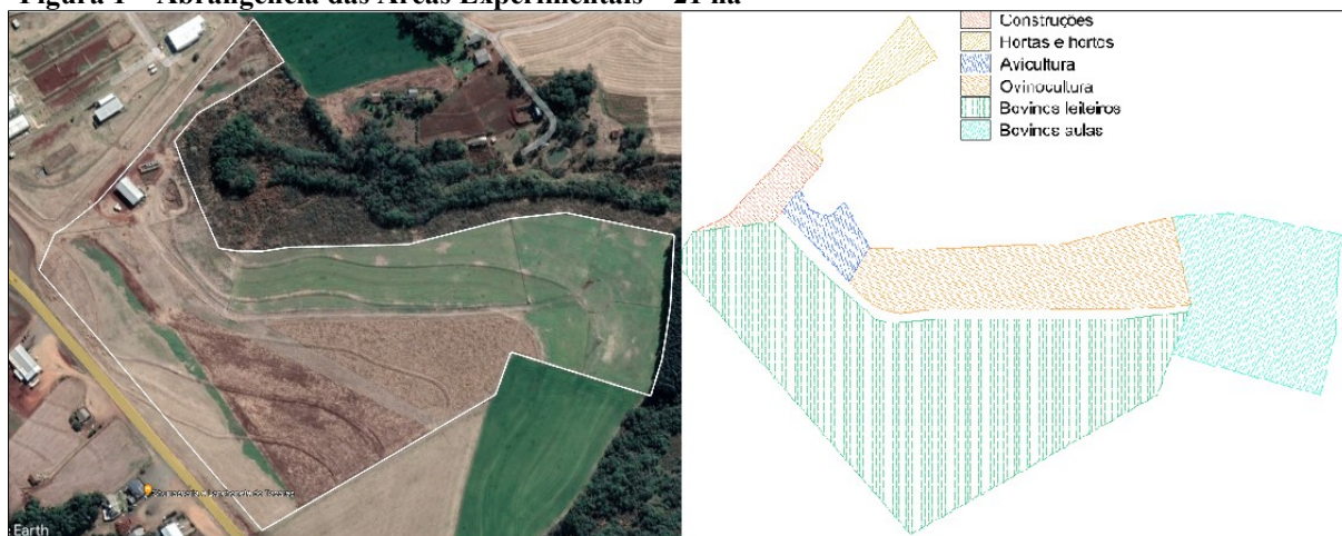
Figura 1 – Abrangência das Áreas Experimentais – 21 ha