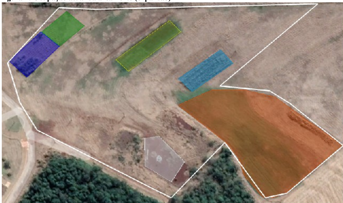
Figura 2: Ocupação atual da área norte (expansão)

azul escuro (área antiga de cana da Embrapa), verde claro (variedades de mandioca da Embrapa), amarelo (experimentos com milho silageiro), ciano (nova área de canas da Embrapa), laranja (experimentos com forrageiras) e branco (área de depósito de insumos).