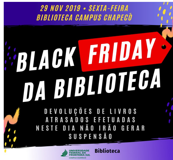
Figura 13 – Cartaz de divulgação