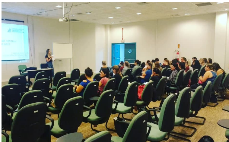
Figura 1 – Oficina de ABNT