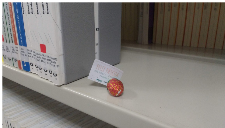
Figura 4 – Ovinho na estante