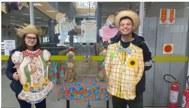
Figura 7 – Ação de São João