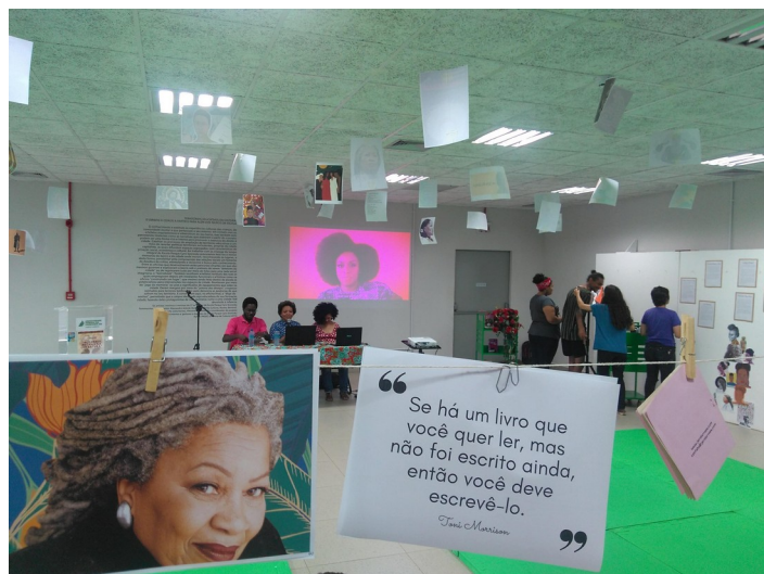
Figura 9 – Visão geral do debate de abertura