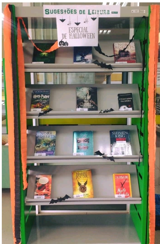
Figura 11 – Sugestões de leitura