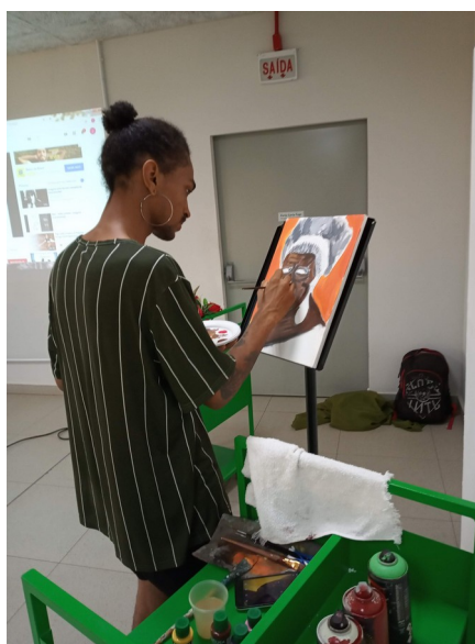
Figura 10 – Pintura temática sendo realizada no evento de abertura