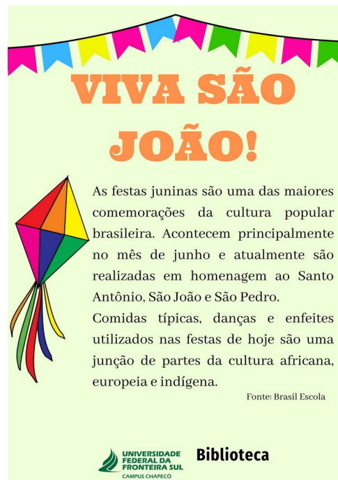
Figura 6 – Cartaz de São João

Também com o objetivo de trazer os usuários para o espaço da biblioteca e criar momentos de descontração na rotina de estudos da comunidade acadêmica, foi realizada a ação de São João entre os dias 26/06/2019 e 12/07/2019.