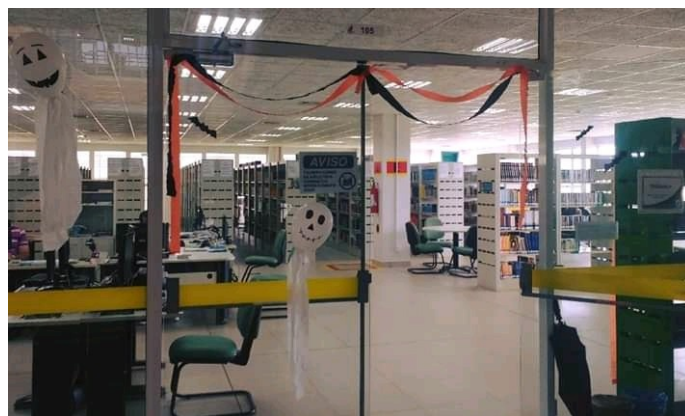
Figura 12 – Entrada da biblioteca