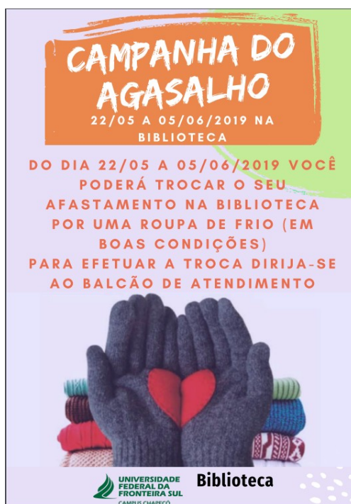
Figura 2 – Material de divulgação da campanha