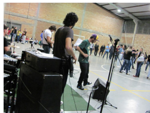
Música na UFFS teve apresentações no Seminário e na escola Érico Veríssimo