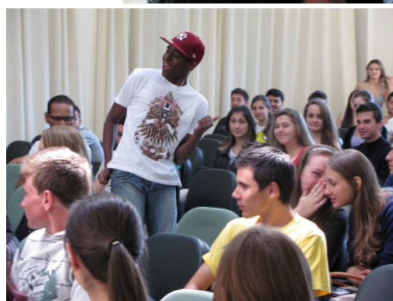
Apresentação de dança da escola Primeiro Ato na tarde de terça-feira