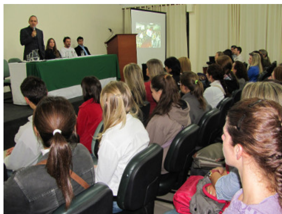
Ato de recepção realizado na noite de segunda-feira

Durante a semana ainda aconteceram apresentações de música e gincana organizada pelos próprios estudantes por meio do DCE. Hoje (26), para fechar a programação, será realizada a apresentação da peça “Quando eu tinha...”, do Grupo Duo em Contato de Porto Alegre-RS, às 18h, no auditório da UFFS - Campus Erechim.