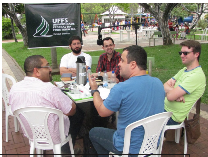
Gravação de episódio de Podcast "Res Cogitans" ao vivo na Feira do Livro. Atividade realizada na quinta-feira (8).