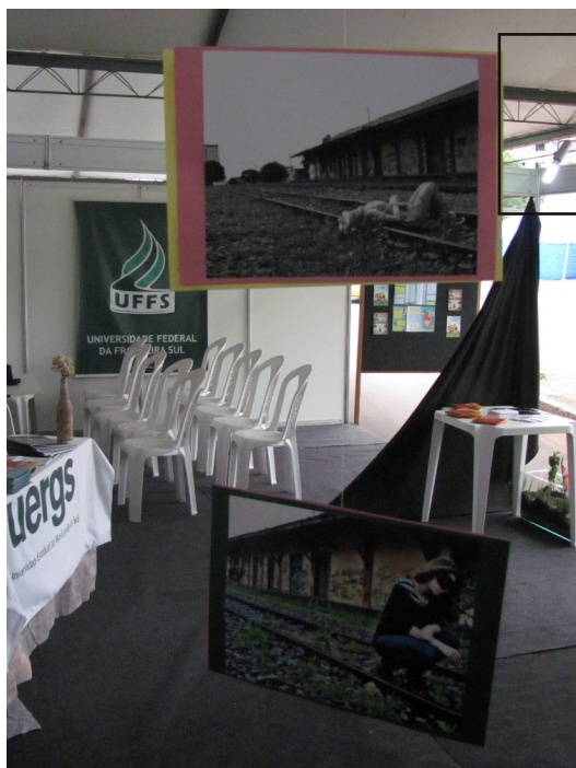
Exposição de livros e fotografias na Lona do Arquivo Histórico Municipal (atividade permanente).

Foi aberta na quarta-feira (07), a Feira do Livro de Erechim. A promoção é da prefeitura, através da Secretaria de Cultura, Esporte e Turismo, com o apoio e participação de diversas entidades, organizações da sociedade civil e instituições de ensino, entre as quais a Universidade Federal da Fronteira Sul (UFFS) - Campus Erechim. A programação segue até no próximo domingo (11). Confira algumas das atividades que a UFFS desenvolveu por lá: