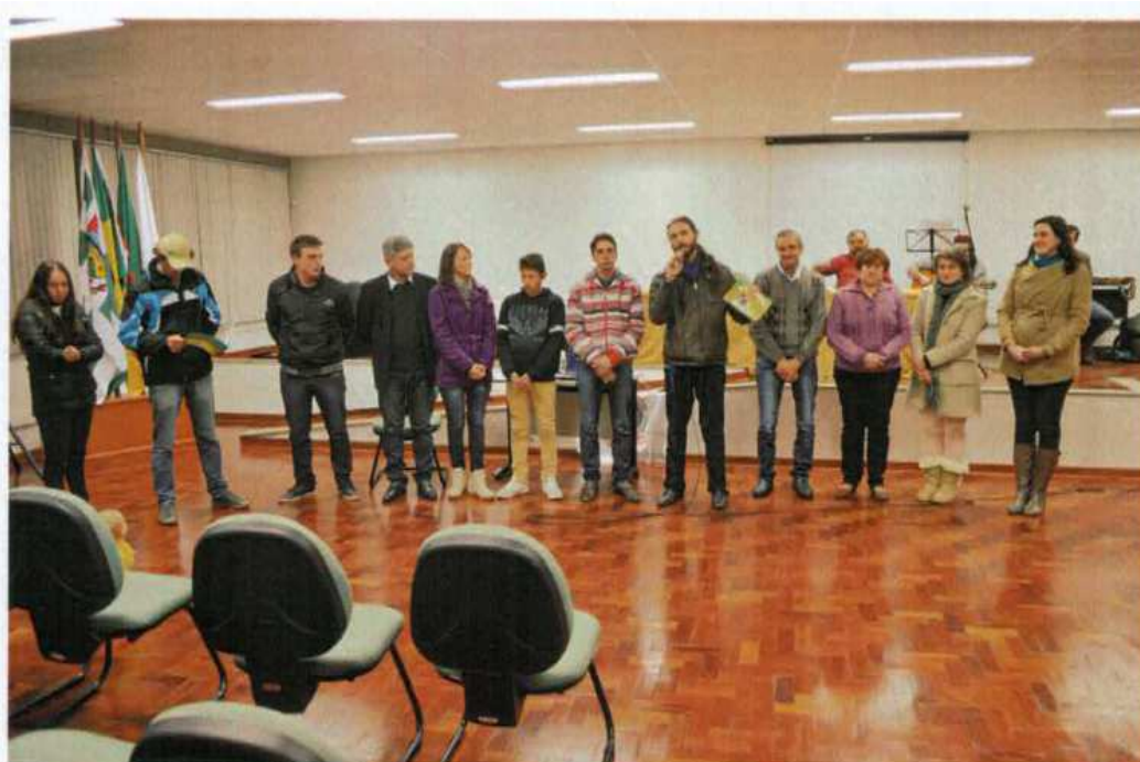
7. Apresentação de cartilha (História em Quadrinhos) com a temática “Horta Agroecológica”, produção do curso em parceria com famílias de pequenos agricultores.

Avenida Fernando Machado, 108-E, Centro, Chapecó-SC, CEP 89802-112, 49 2049-3774 proad.suadm@uffs.edu.br, www.uffs.edu.br