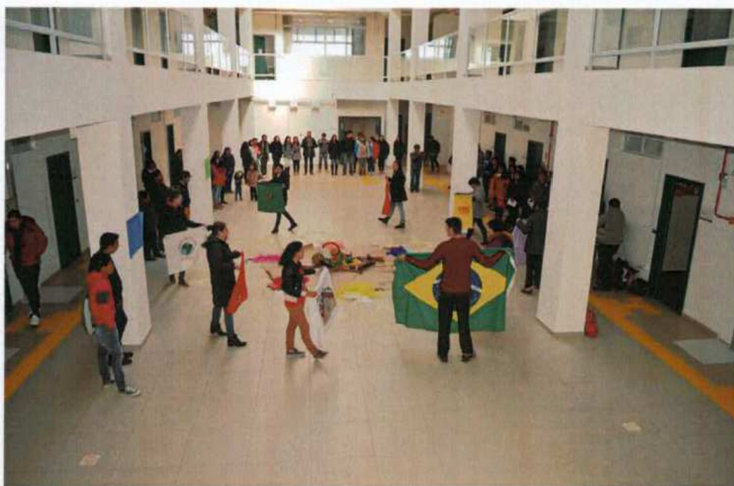
5. Seminário integrador de fim de semestre

SERVIÇO PÚBLICO FEDERAL UNIVERSIDADE FEDERAL DA FRONTEIRA SUL SUPERINTENDÊNCIA ADMINISTRATIVA Avenida Fernando Machado, 108-E, Centro, Chapecó-SC, CEP 89802-112, 49 2049-3774 proad.suadm@uffs.edu.br, www.uffs.edu.br