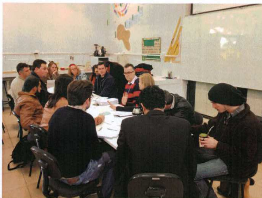
8. Reunião na Universidade Federal do Rio Grande do Sul – UFRGS – (com representantes de instituições que têm o curso de Educação do Campo) em preparação ao III SIFEDOC - III Seminário Internacional de Educação do Campo e III Fórum de Educação do Campo da Região Norte do Rio Grande do Sul.