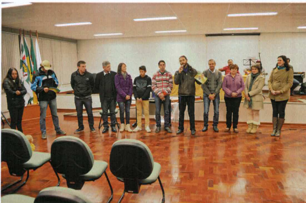
7. Apresentação de cartilha (História em Quadrinhos) com a temática “Horta Agroecológica”, produção do curso em parceria com famílias de pequenos agricultores.