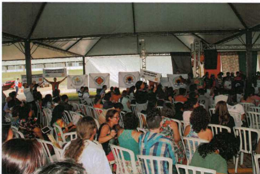
2.Participação de alunos e professores no Seminário Nacional de Educação do Campo em Laranjeiras do Sul