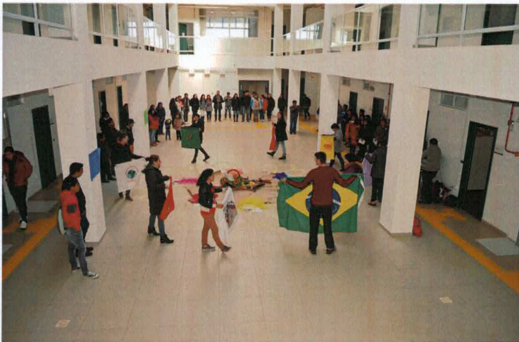
5. Seminário integrador de fim de semestre