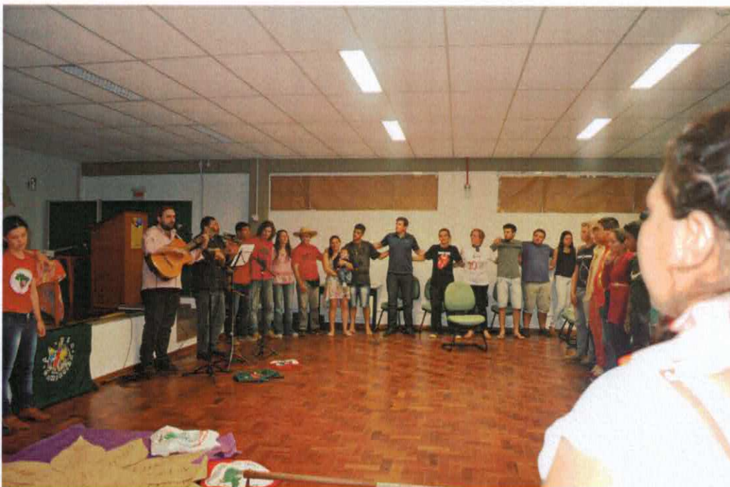
6. II Seminário Regional em Educação do Campo - SIFEDOC - Erechim