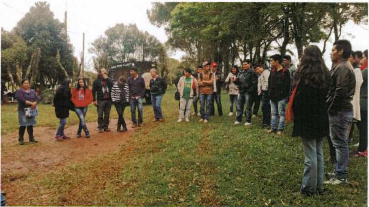
4. Visita do curso ao Instituto Educar. no município de Pontão.