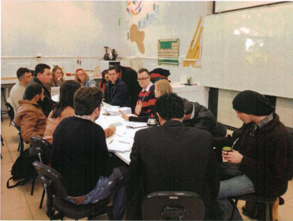
8. Reunião na Universidade Federal do Rio Grande do Sul – UFRGS – (com representantes de instituições que têm o curso de Educação do Campo) em preparação ao III SIFEDOC - III Seminário Internacional de Educação do Campo e III Fórum de Educação do Campo da Região Norte do Rio Grande do Sul.