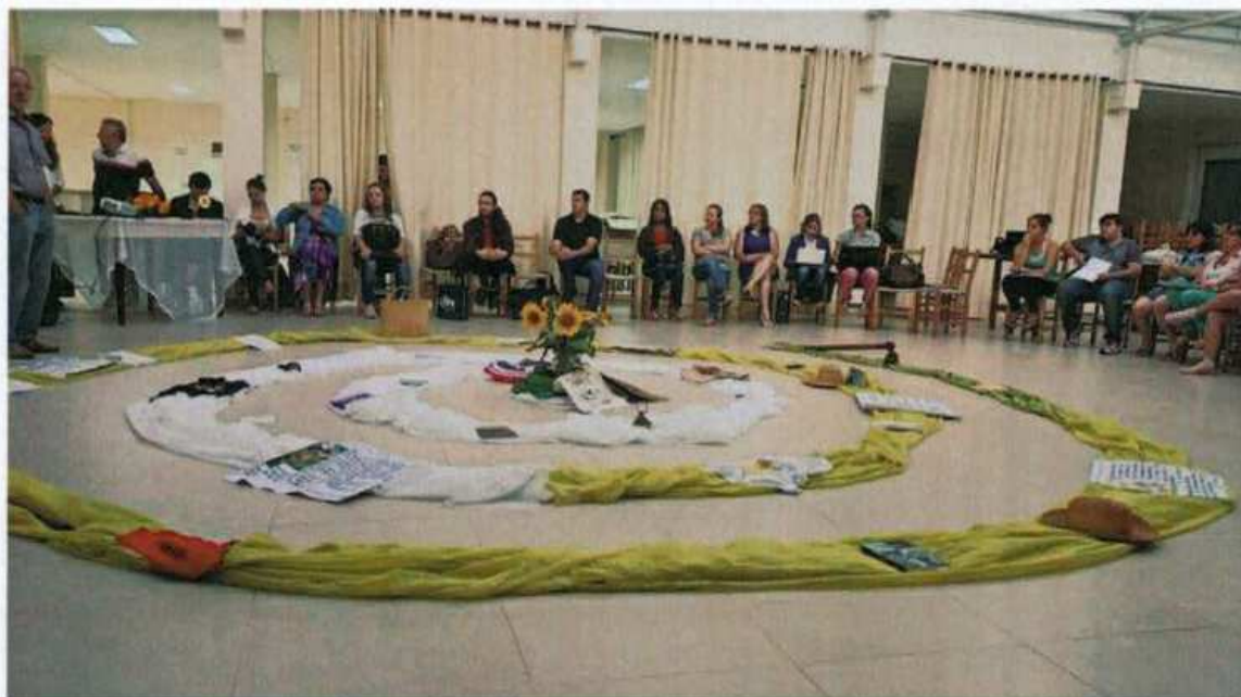
1.Seminários integradores que acontecem no final de cada semestre.