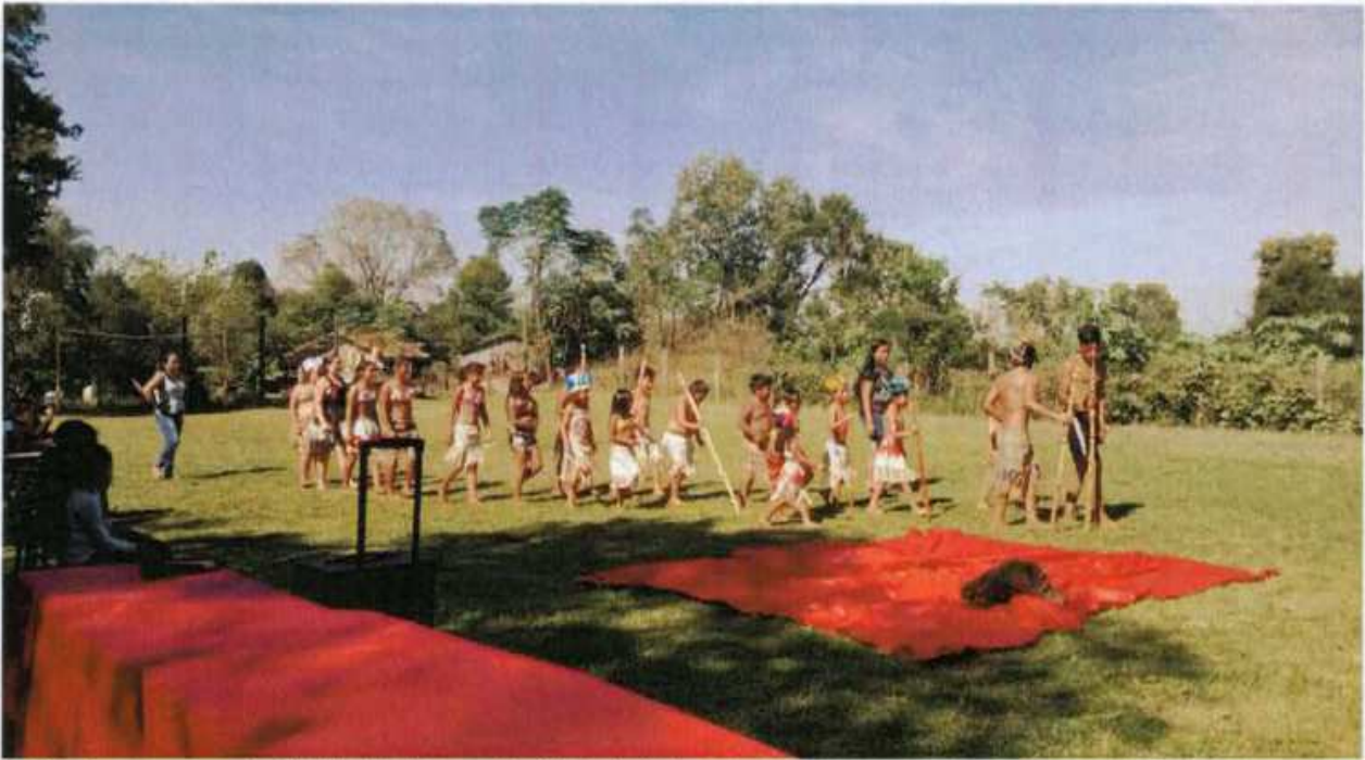
3. Visita do curso à Aldeia indígena de Pinhalzinho

SERVIÇO PÚBLICO FEDERAL UNIVERSIDADE FEDERAL DA FRONTEIRA SUL SUPERINTENDÊNCIA ADMINISTRATIVA Avenida Fernando Machado, 108-E, Centro, Chapecó-SC, CEP 89802-112, 49 2049-3774 proad.suadm@uffs.edu.br, www.uffs.edu.br