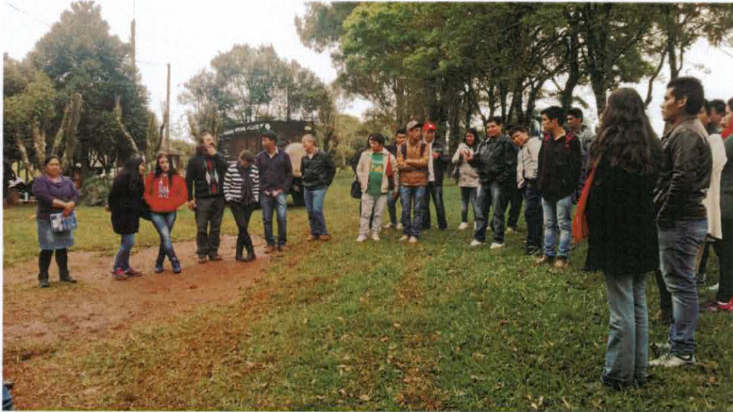
4. Visita do curso ao Instituto Educar, no município de Pontão.