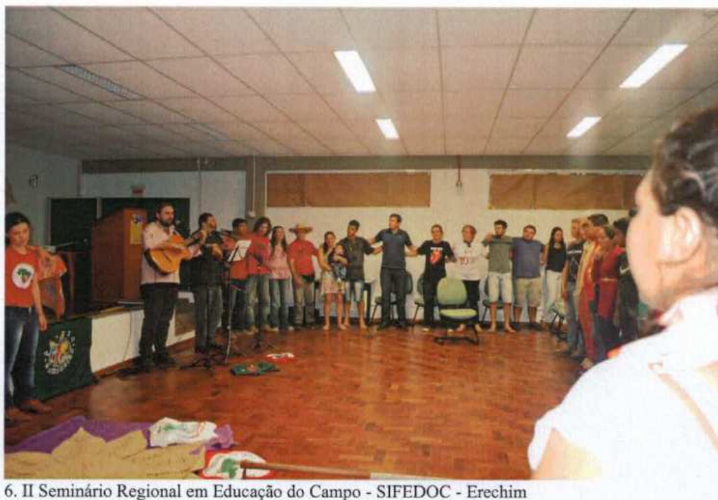
6. II Seminário Regional em Educação do Campo - SIFEDOC - Erechim