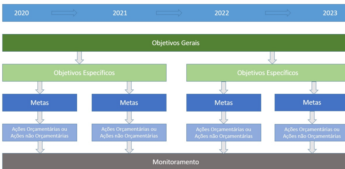
Figura 1: Estrutura do PPA da UFES 2020 – 2023.