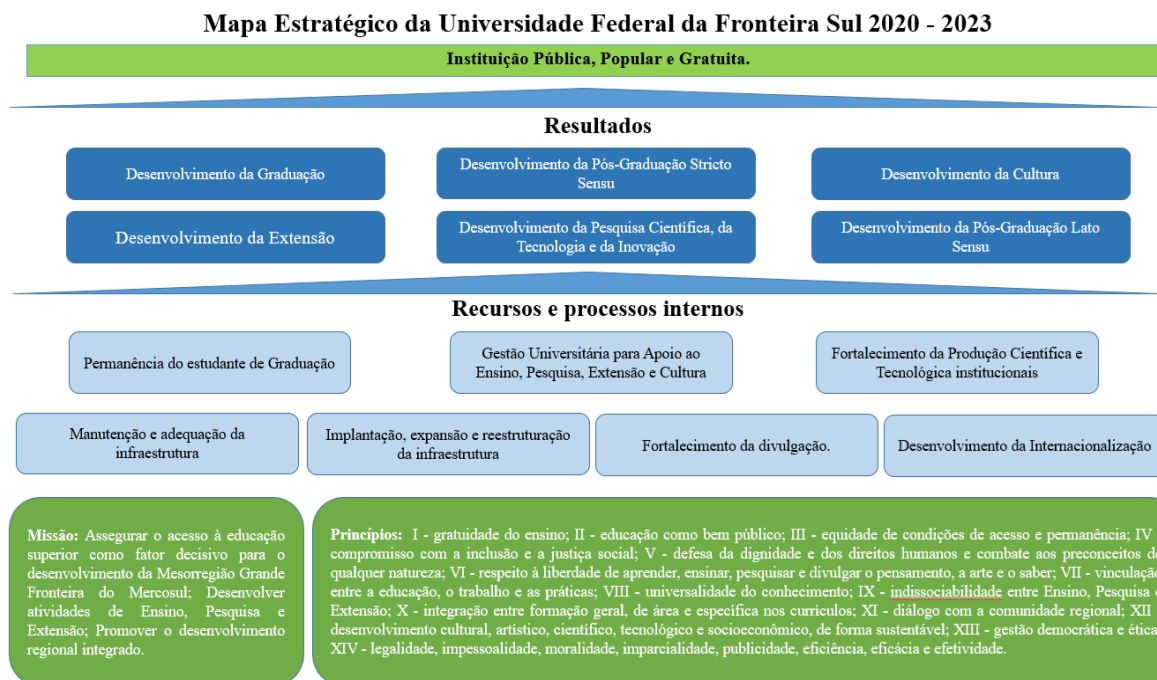
Figura 3: Mapa Estratégico da Universidade Federal da Fronteira Sul