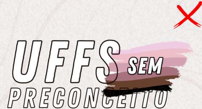
Em cores que não estão na paleta