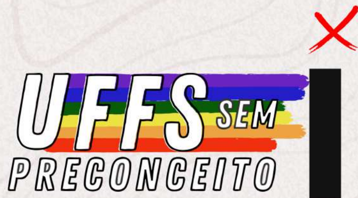
Muito próximo a outro elemento