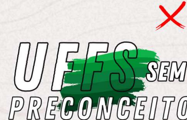
Com o ícone em local diferente