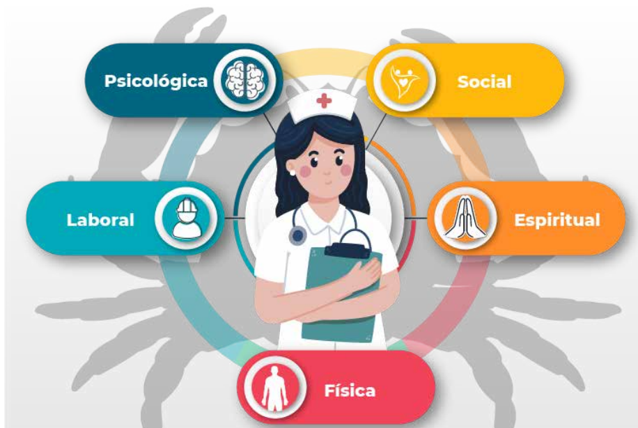
Figura 01 – A Enfermagem e as dimensões da vida humana no adoecimento por câncer

Frente ao contextualizado e considerando que o cuidado de enfermagem deve ser operacionalizado a partir do Processo de Enfermagem (PE), o presente capítulo tem como objetivo descrever os marcos históricos relacionados à assistência em oncologia e o cuidado de enfermagem.